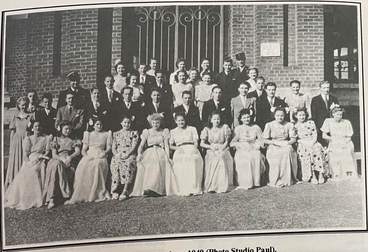
Avesnes-lez-Aubert : La classe 1949 (Photo Studio Paul).