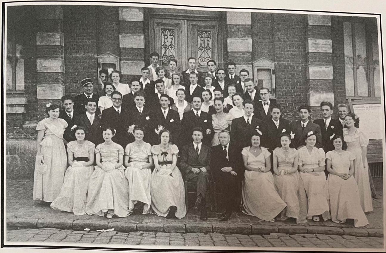
Avesnes-lez-Aubert : La classe 1951.