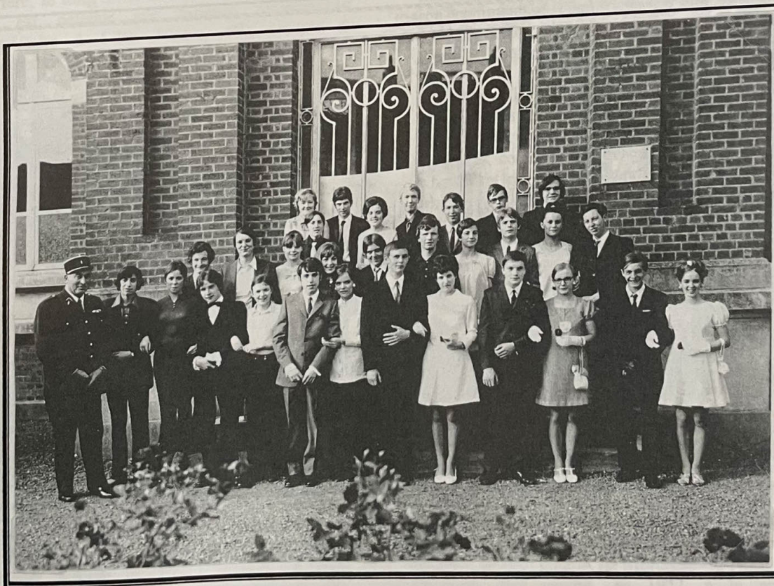
Avesnes-lez-Aubert : La classe 1971.

Vers 2 heures du matin, le bal se terminait et chacun rentrait chez soi, ivre de fatigue. Certaines jeunes filles avaient les pieds si gonflés que leurs parents devaient les soutenir tout au long du trajet, tant elles avaient peine à marcher. Mais quelle importance... Ne venaient-elles pas de vivre un des plus beaux jours de leur vie!