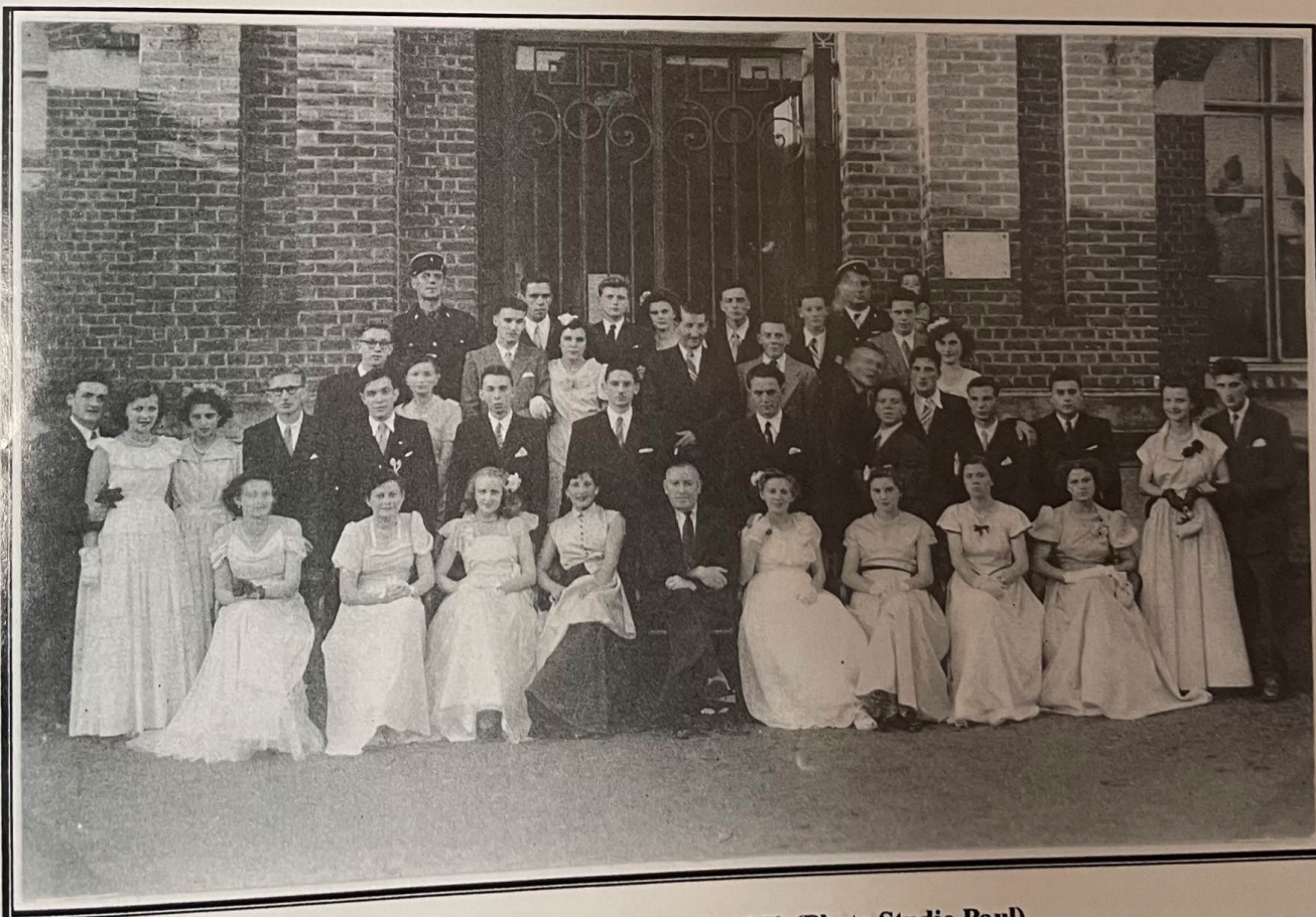
Avesnes-lez-Aubert : La classe 1952.