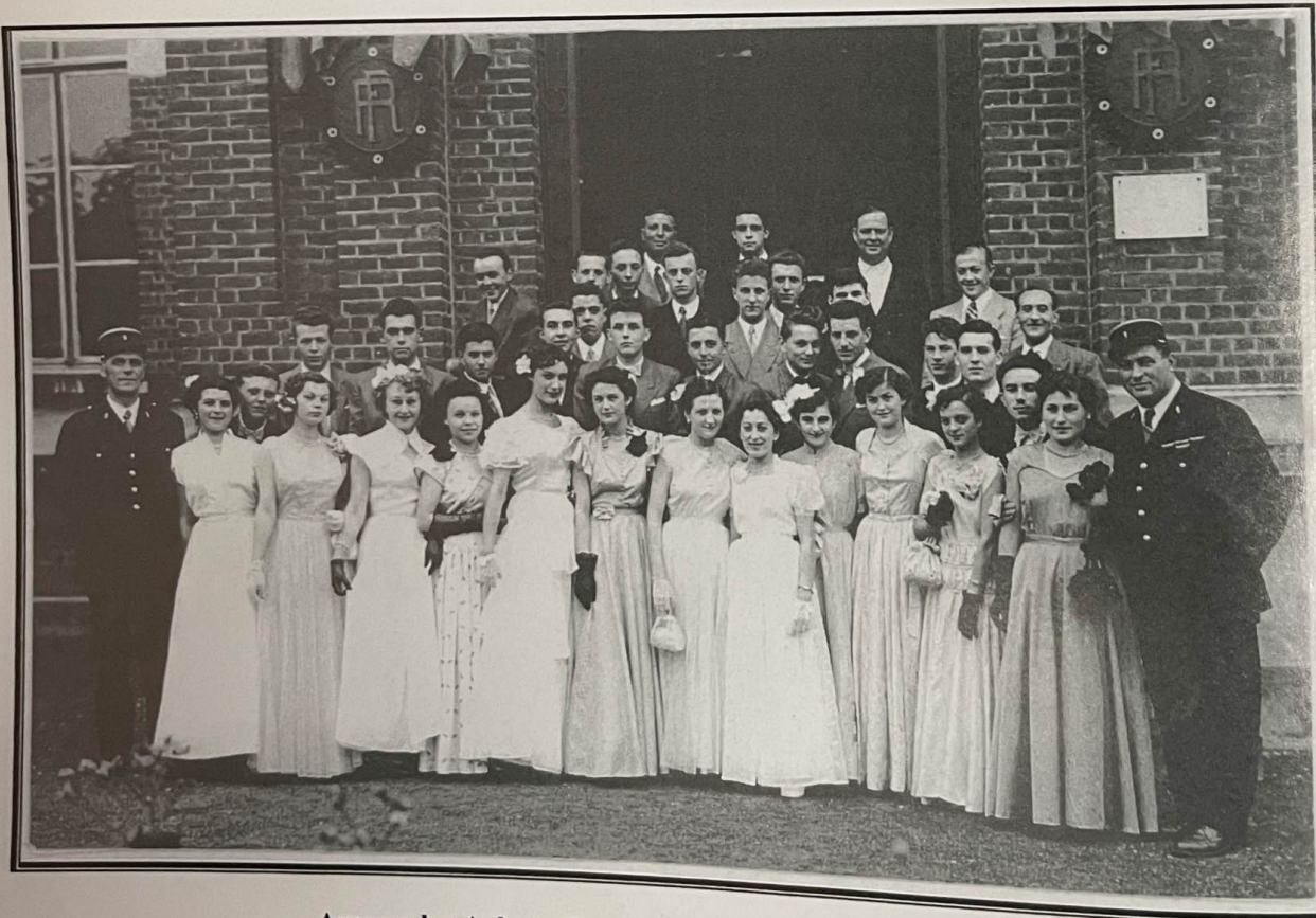
Avesnes-lez-Aubert : La classe 1954.