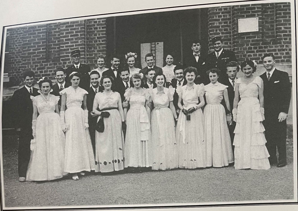
Avesnes-lez-Aubert : La classe 1953.