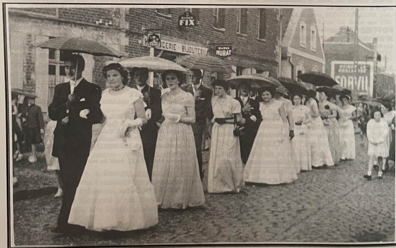
Avesnes-lez-Aubert : La classe 1955.