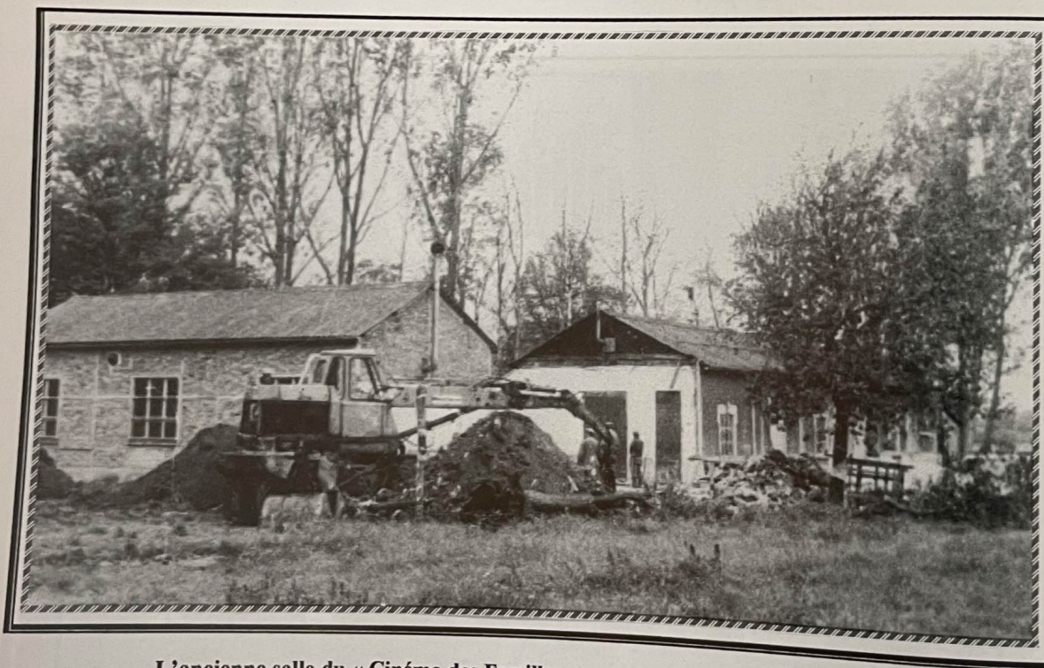
L'ancienne salle du « Cinéma des Familles » avec, à gauche, le bar-salle de jeux, en 1975, lors des travaux de rénovation du Centre Benoît Frachon.