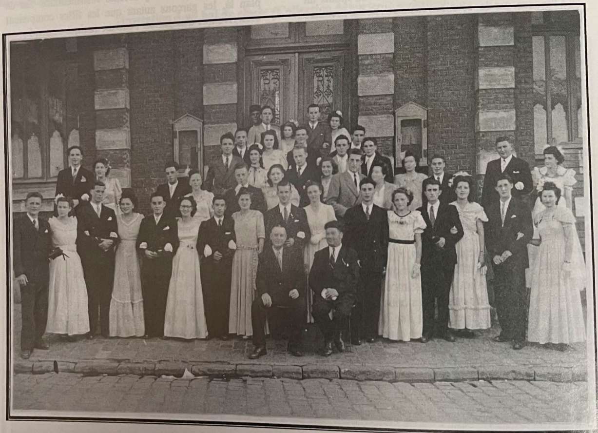
Avesnes-lez-Aubert : La classe 1950.