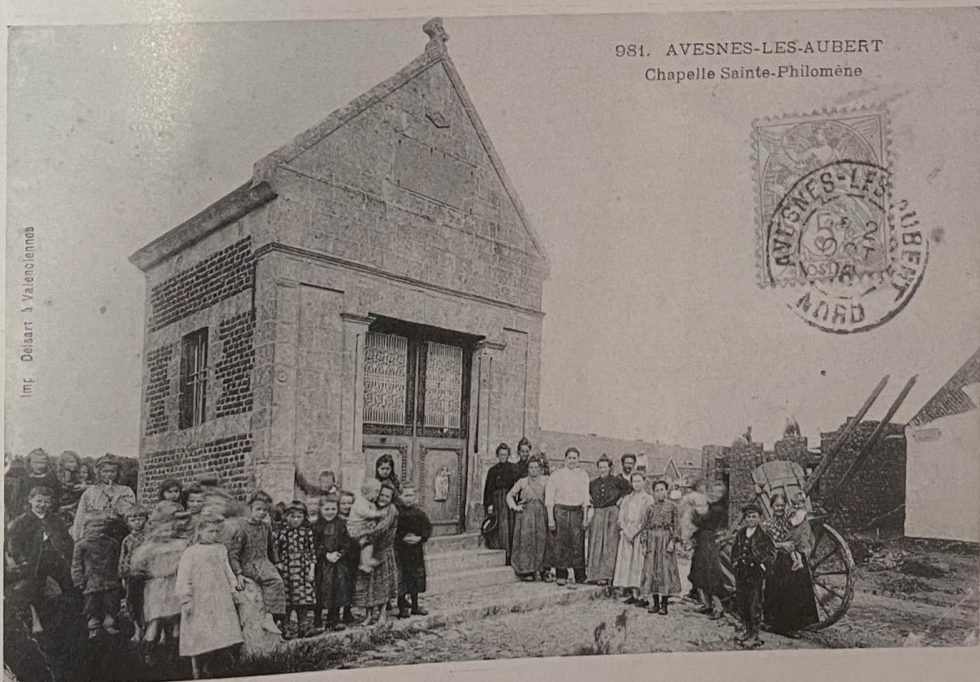
carte postale oblitérée le 6 Octobre 1902, le plus ancien document de la chapelle.

Plus près de nous, la chapelle St-Roch située rue Henri Barbusse, elle aussi disparue.