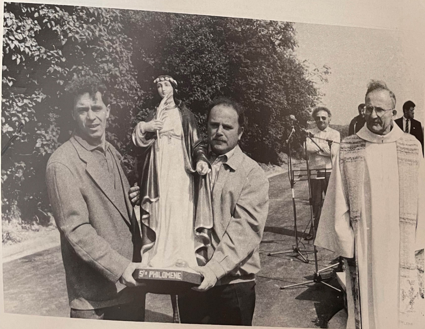
Lors de l'inauguration