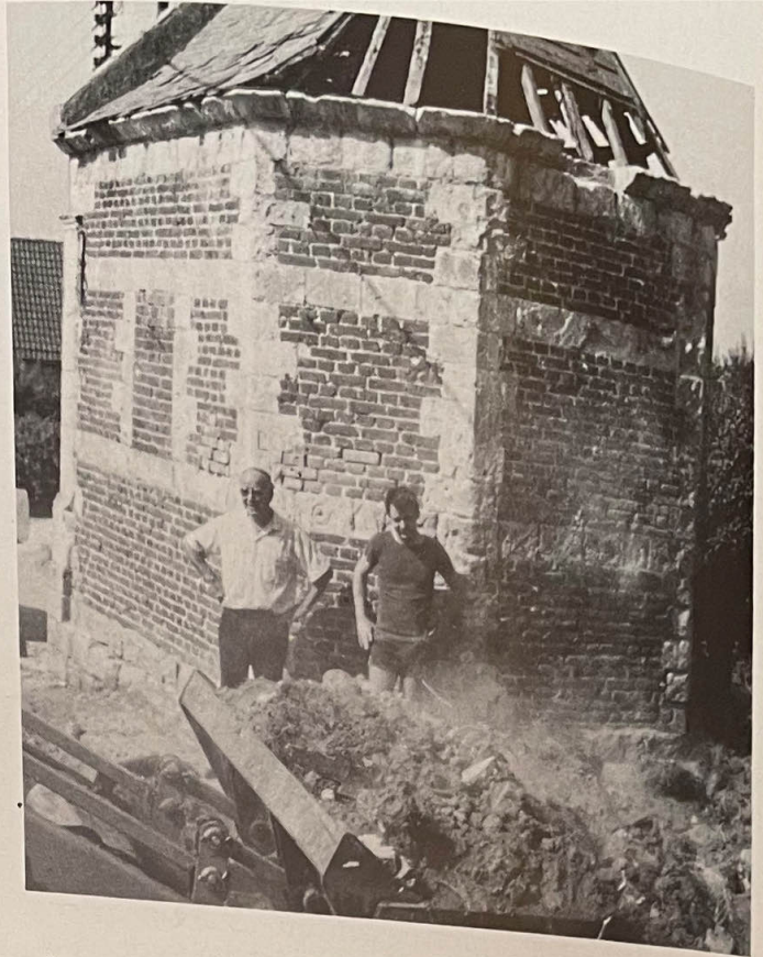
La chapelle avant les travaux